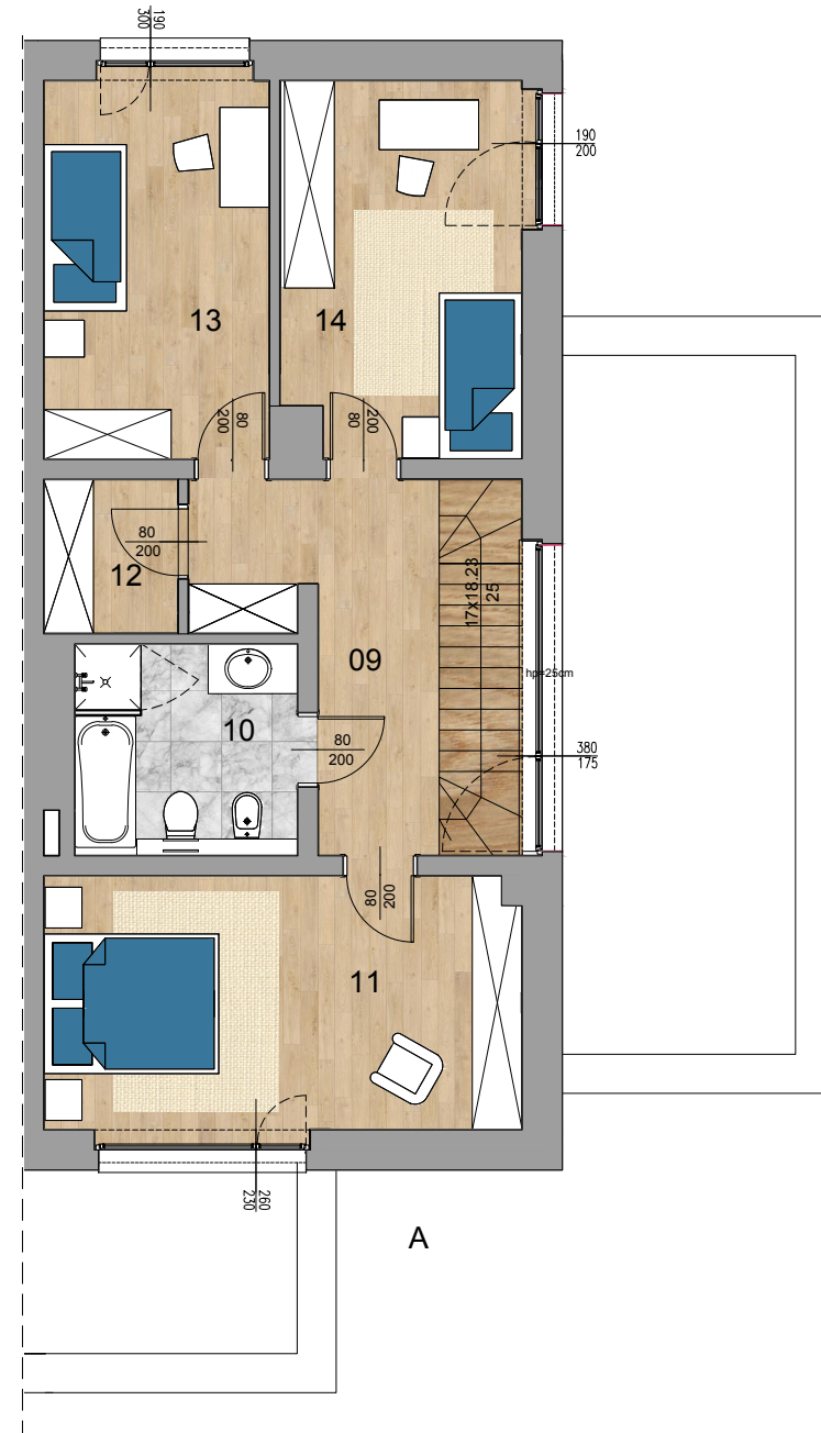
RZUT 1 PIETRA